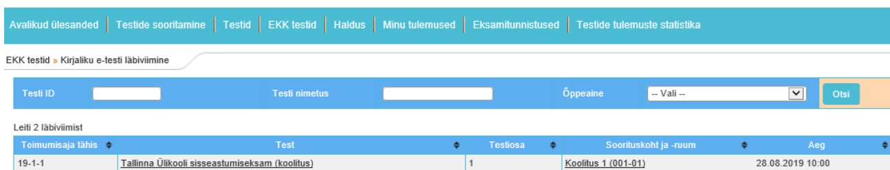
Pilt 1. Testi avamine

1.1.3 Pärast sisselogimist tuleb valida menüüst EKK testid → Kirjaliku e-testi läbiviimine ja klõpsata avaneval lehel testi lingil (vt pilt 1).